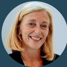
CHARLOTTE CAUBEL SECÉTAIRE D'ÉTAT CHARGÉE DE L'ENFANCE