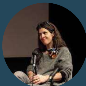
JOHANNA BEDEAU RÉALISATRICE

L'outil de formation créé par la CIIVISE, en lien avec les ministères concernés, est composé d'un court-métrage, réalisé par Johanna Bedeau, ainsi que d'un livret d'accompagnement.