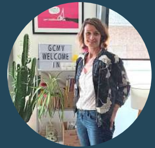
VÉRONIQUE BÉCHU OFFICE CENTRAL POUR LA RÉPRESSION DES VIOLENCES AUX PERSONNES